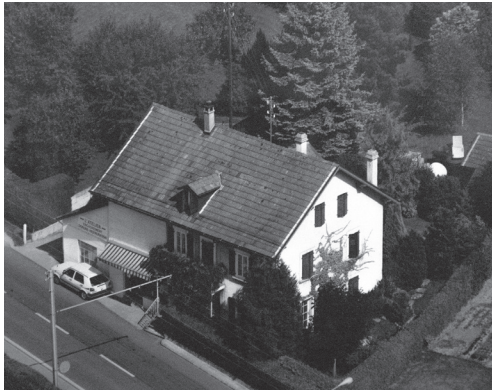
Le Schiffsdatschreibermuseum Paderborn.

Contextualisation et commentaire, par Reynaldo Bibicuis